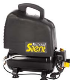
Vento Silent 66